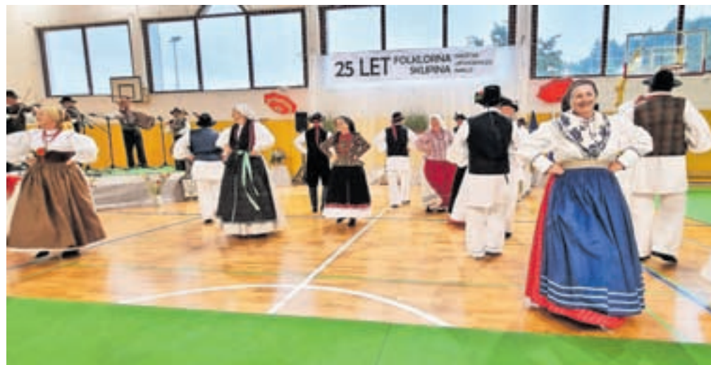
Nakelski folkloristi so se predstavili tudi s spletom prekmurskih plesov.

stje, skupina orgličarjev Loške orglice, ki deluje pri Društvu upokojencev Škofja Loka, iz Cerklj so dogodek popestrili člani KD Folklorne Cerklje in Cerkljanski gavnariji, nastopil pa je tudi orgličarski Sorarmonica duo iz Sore pri Medvodah. Po podelitvi priznanj – Andrej Ko-