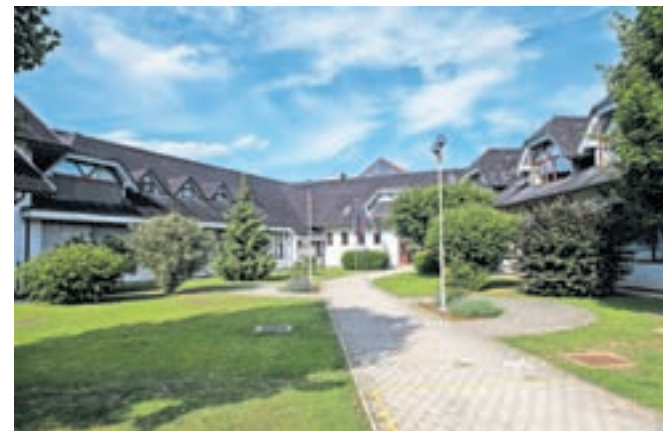
Na občini pričakujejo gradbeno dovoljenje za dve dodatni učilnici v mansardi matične OŠ Naklo.