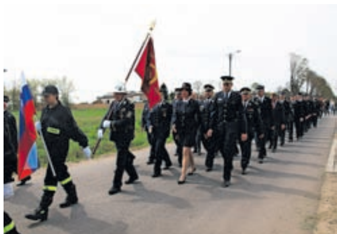
Sodelovali so v gasilski paradi