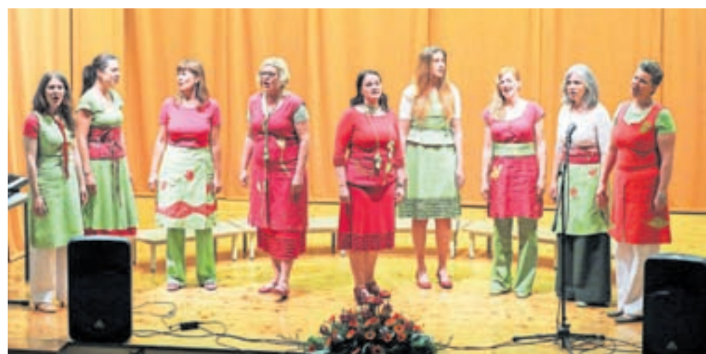
Legendarne Katice so s pesmijo čestitale zboru in navdušile občinstvo.