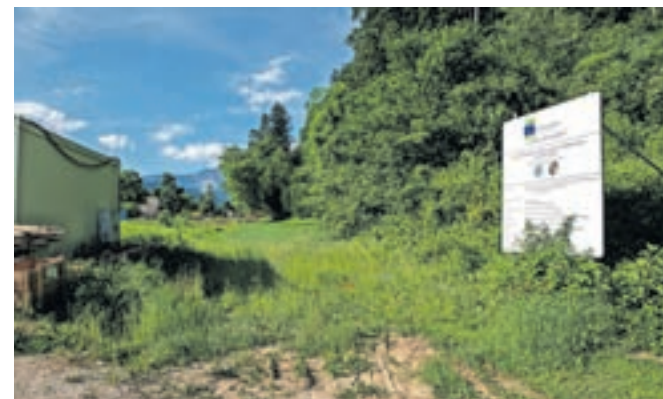
V Zadragi potekajo zemeljska dela za vodohran, vodovodne cevi so že položene.