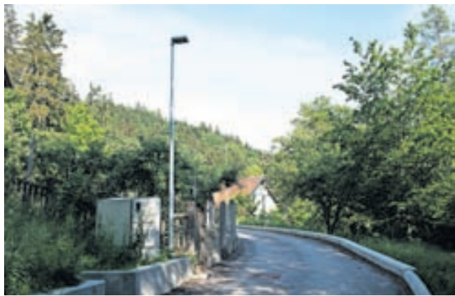
Investicija je bila tudi v Gobovcah, kjer so uredili dve cesti in javno razsvetljavo.

Predvsem bi se jim zahvalil za razumevanje, potrpežljivost in sodelovanje v zahtevnih zadnjih dveh letih razglašene epidemije covid-19. Znova pa se je v naših krajih začelo družabno življenje, kulturne prireditve, tudi vsi občni zbori so bili spomladi v glavnem izvedeni v živo. V dneh pred občinskim praznikom je že zelo razgibano s številnimi prireditvami, ki jih organizirajo domača društva in vse občane lepo vabim, da se jih udeležite v sproščenem in prijetnem vzdušju.