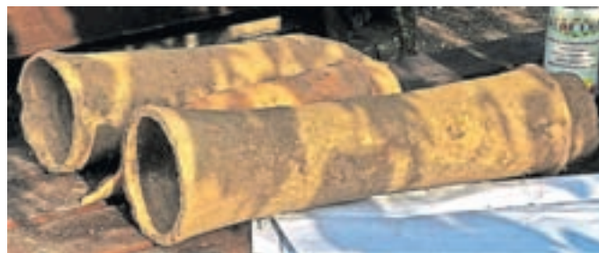
Pol tisočletja stare cevi nakelskega vodovoda.

Arheologinji iz Gorenjskega muzeja sta še dodali: »Vodovod z veliko verjetnostjo lahko datiramo v 16. stoletje. Tekel je iz jame Velika Lebinica, vzhodno od Strahinja, proti Naklemu in Pivki. Odkrite cevi se v Naklem glede na obliko in časovno ujema-jo z drugimi poznosrednjeveškimi ali zgodnjenovoveškimi vodovodi. Po obliki so cevi najbolj podobne tistim iz Javorij nad Poljanami v Poljanski dolini.«