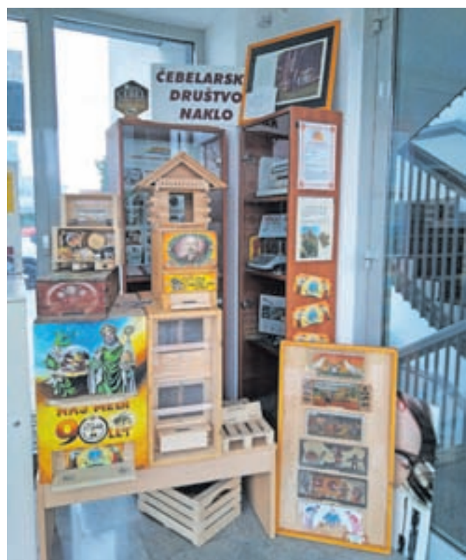
Čebelarški kotiček v predverju občinske stavbe

Naklo – Čebelarstvo društvo Naklo vabi na slavnostno akademijo ob 90-letnici samostojne organiziranosti Čebelarkega društva Naklo in 120-letnici organiziranega čebelarstva na Kranjskem. Akademija bo v petek, 17. junija, ob 19.30 v Kulturnem domu Janeza Filipiča v Naklem. Ob tej priložnosti bo tudi odprtje čebelarke razstave in degustacija medenih izdelkov.