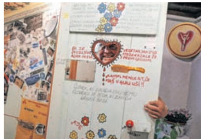
Stene v stranišču na štrbunk so popart, iz obdobja sedemdesetih let prejšnjega stoletja, s slogani, ki so jih pisali na stene ...

dlih firm ...« je pojasnil Bandelj. Stranišče na štrbunk je na zunaj prijazno, cvetoče, tak svet je želel pokazati. A kaj vidimo, ko pogledamo v njegovo luknjo? Njegova dela nas nagovarjajo, zastavljajo vprašanja. Vrsta njegovih del se usmerja k tradiciji sloven-