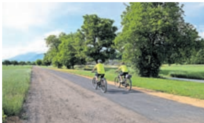
S kolesarjenjem DU Naklo bodo kolesarsko pot Strahinj–Spodnje duplje simbolično odprli 25. junija.