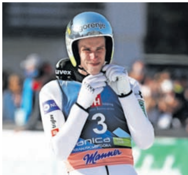
Rad bi ostal povezan s tem športom.

Rad bi ostal v smučarskih skokih. Sedaj delujem v tržiškem klubu, dogovarjal pa sem se tudi za delo v tujini, vendar dogovor ni bil dosežen. Rad delam z najmlajšimi. Lahko jim veliko dam. Smučarski skoki so mi všeč, so prijetno okolje in se mi tudi po toliko letih niso zagnusili.