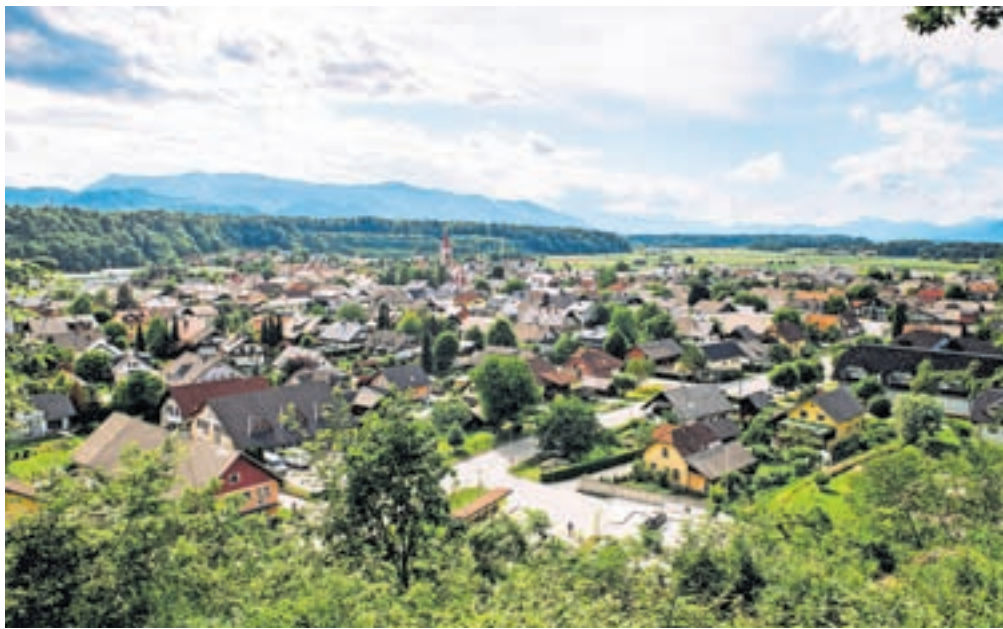
Čudovit razgled na Naklo