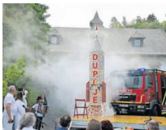
Ni naključje, da je najbolj dominanten objekt na razstavi raketa. Ob odprtju razstave je bil tudi performans.