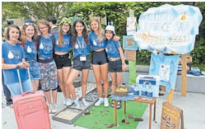
Učenke OŠ Naklo so na zaključni prireditvi predstavile Ekološko letovišče Sava.

ideje, da bi naredili Ekološko letovišče Sava ali Eco Sava resort. Poskušale smo zajeti čim več, kar ponujata hladna tekoča in izvirska voda in druge oblike zdravega življenja. Dela smo se lotile sistematično. Predstavljamo, kaj bi bilo mogoče v Ekološkem