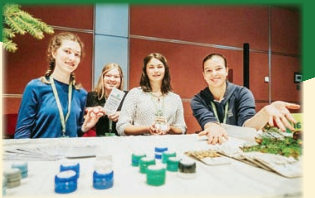
Resina pri prodaji izdelkov ( https://www.jaslovenija.si/nt-2022 )

mocija in prodaja, višek pa je priprava finančnega poročila in predstavitev na sejni dijaških podjetij. V Biotehničnem centru Naklo je to šolsko leto delovalo 11 dijaških podjetij. Regionalno srečanje gorenjskih dijaških podjetij je bilo v Škofji Loki, nacionalno srečanje finalistov pa v Ljubljani. Me smo dijakinje 3. letnika programov kmetijsko-podjetniški ter hortikulturni tehnik. Ustanovile smo dijaško podjetje