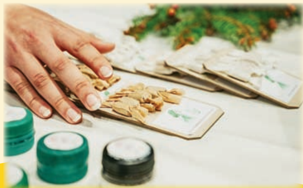
Žvečilni gumiji iz smrekove smole