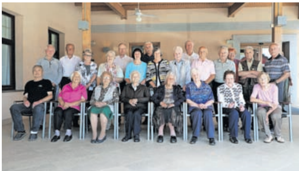
Jubilanti, ki so 80, 90 in več let dopolnili od julija do decembra lani, z županom ter predsednikom in tajnico DU Naklo