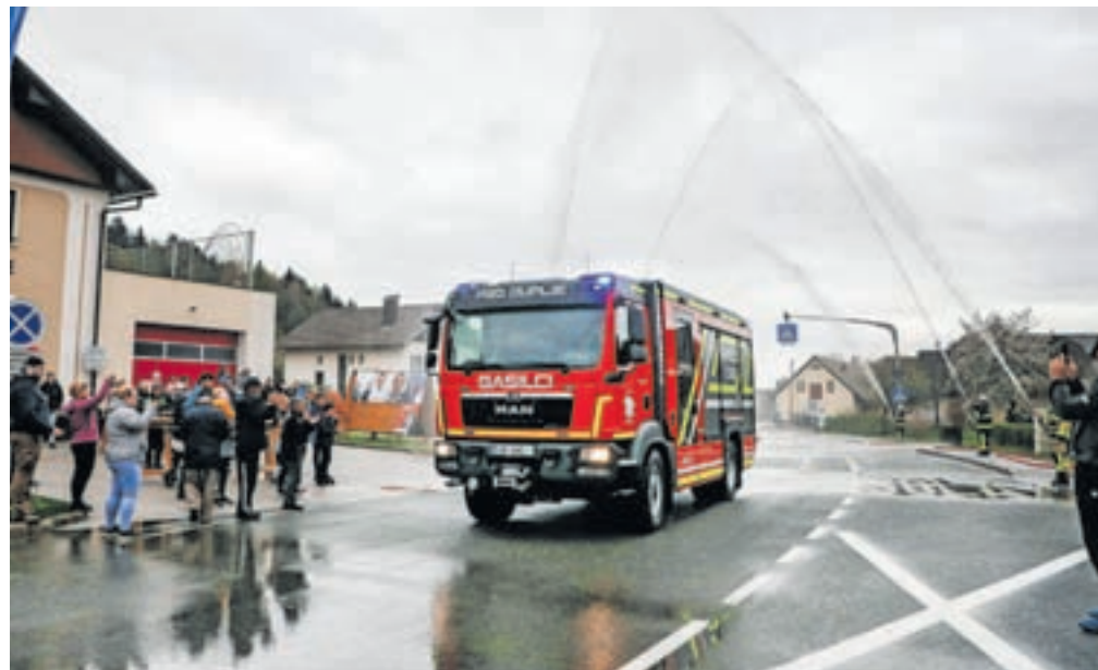
Dupljski gasilci so vozni park obogatili z novim gasilskim vozilom GVC-1.