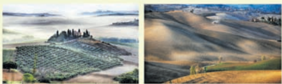
Čudovite fotografije Viktorja Šmida