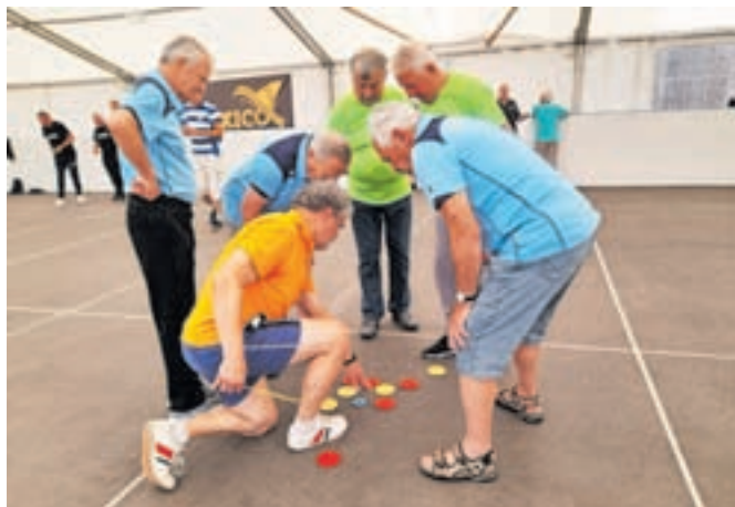
Šlo je za zares. Kdo je bliže? Sodnik si je pomagal z metrom.