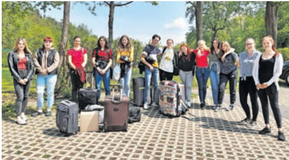
Dijaki strahinjske srednje šole in njihovi gostitelji po prihodu v Ehrental