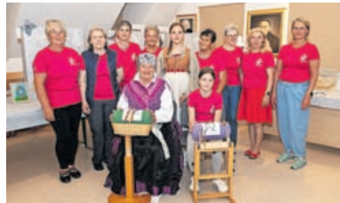
Taborske Urške so na ogled postavile peto klekljarsko razstavo, ki so jo poimenovala Naklekljano med korono.

Podbrezje – V Pirčevem domu so se maja s peto klekljarsko razstavo predstavile tečajnice in mentorice krožka Taborske Urške, ki že sedmo sezono deluje pod okriljem KD Tabor Podbrezje. Devet klekljaric, najmlajša šteje deset let, je z vzorci in motivi v izdelke zaobjelo vse letne čase in praznike, hkrati so na ogled postavile še razstavo Obrazi, na katero so se pripravljale že v šol-