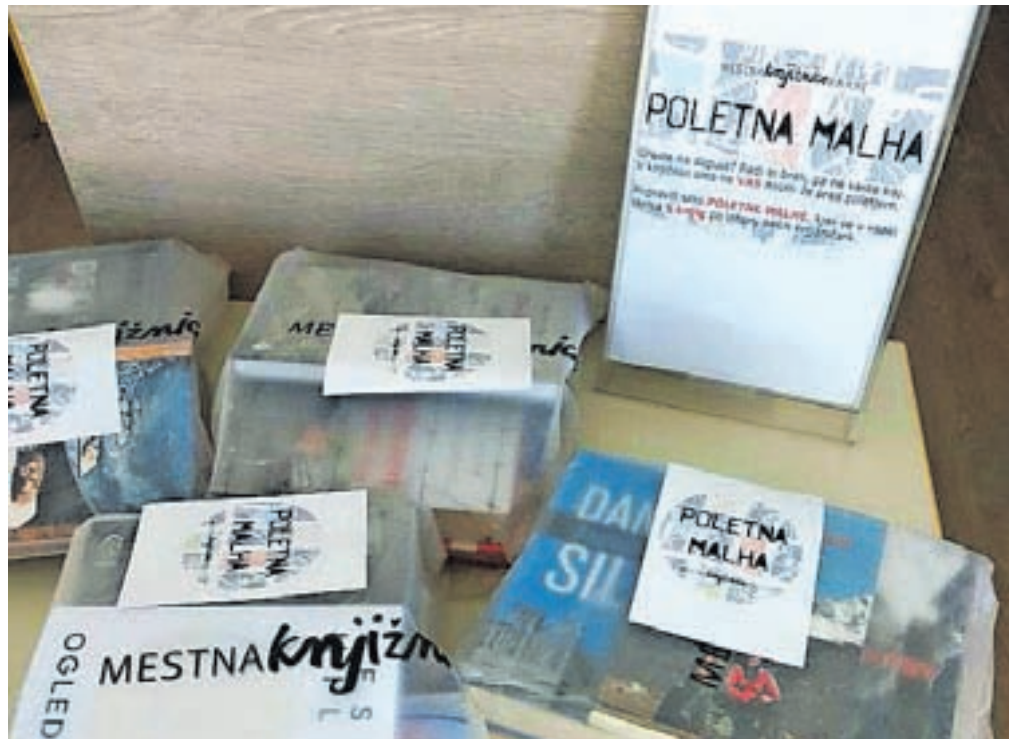
Knjižničarji vsako leto pripravimo tako imenovane poletne malhe.

Za vse, ki bi brali tudi avtorje drugih narodnosti, knjižničarji vsako leto pripravimo tako imenovane poletne malhe. To so torbe, v katerih se skriva pet knjig različnih žanrov po našem izboru. Pride v knjižnico, vzamete poletno malho in si jo izposodite. Za otroke in mladino, ki se sami ne morejo odločiti, kaj bi brali, pa smo pripravili obsežno ponudbo počitniškega branja: knjigolovčke za bralce, ki so stari manj kot osem let, pasje torbe za starost bralcev od 9 do 12 let, kul paket najst za najstnike stare 13 let in več. Lepo vas vabimo tudi k družinskemu branju, ko starši, starejše sestre in bratje, stari starši in drugi odrasli berejo otrokom. Z branjem si krepimo domišljijo, širimo obzorja in neverjetno, a resnično, po-