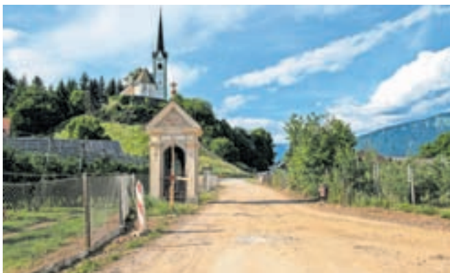
V severnem delu Podbrezjij sta se začeli gradnja kanalizacije ter obnova druge infrastrukture.